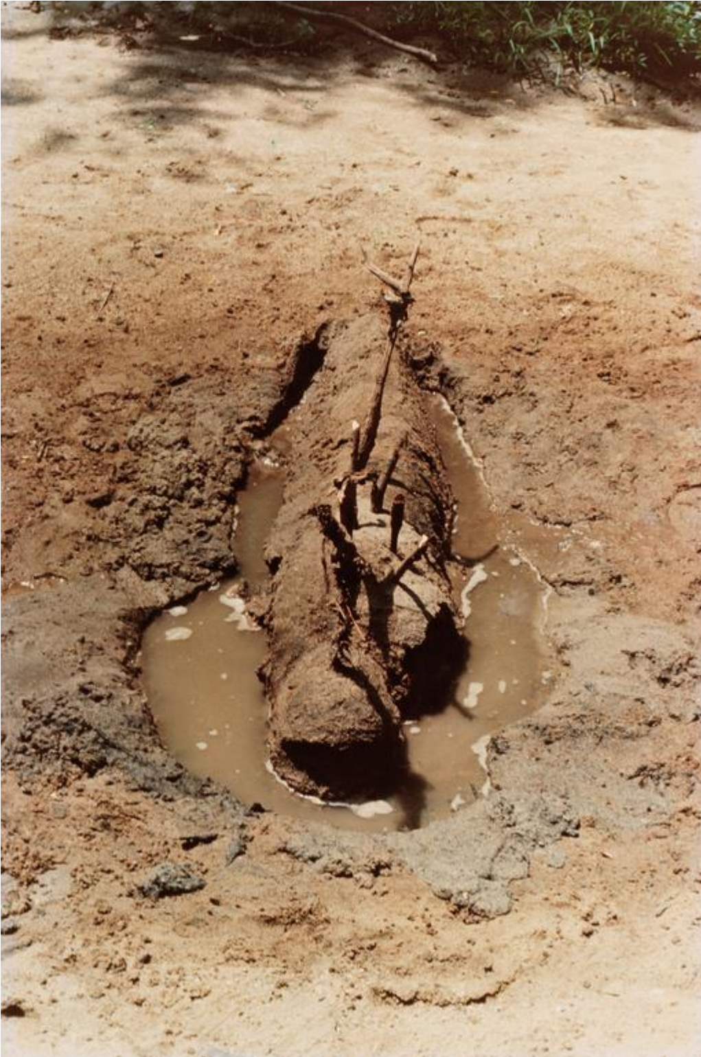
Título de la obra: Sin título Técnica: Fotografía Dimensiones: N/A. Año de realización: 1977.