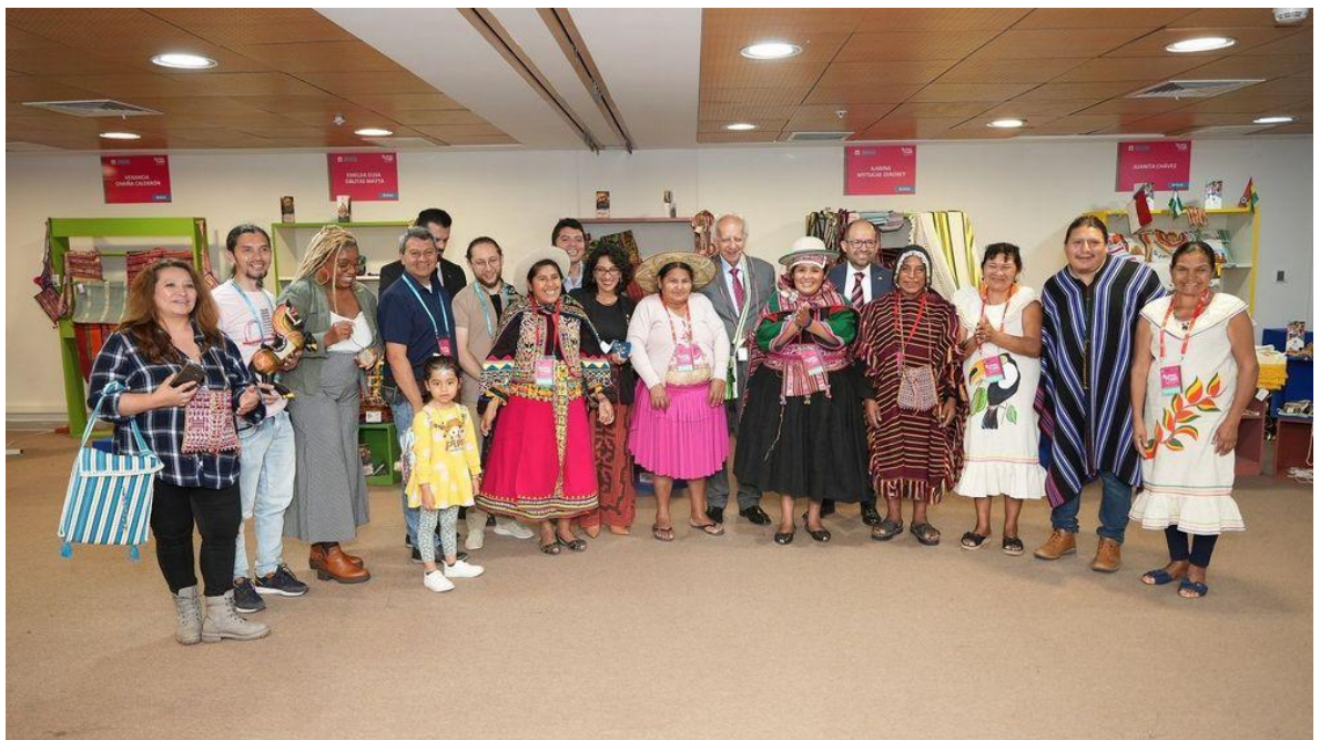
Países De La CAN Acuerdan Acciones Conjuntas Para Promover Identidad Cultural Andina – Comunidad Andina. 27 July 2023, www.comunidadandina.org/notas-de-