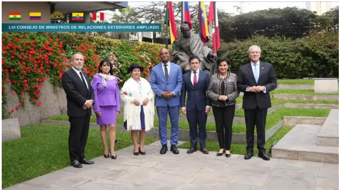
Colombia Asume La Presidencia Pro Tempore De La Comunidad Andina Para El Periodo 2024 - 2025 – Comunidad Andina. 10 Sept. 2024, www.comunidadandina.org/notas-de-prensa/colombia-asume-la-presidencia-pro-tempore-de-la-comunidad-andina-para-el-periodo-2024-2025 .