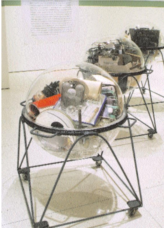
Materiales variados en plexiglás Esferas sobre soportes metálicos con ruedas Esferas con soportes: 43 1/2 x 31 3/4 x 31 3/4 pulg. (110,5 x 80,6 x 80,6 cm); 45 x 31 3/4 x 31 3/4 pulg. (114,3 x 80,6 x 80,6 cm); 49 x 31 3/4 x 31 3/4 pulg. (124,5 x 80,6 x 80,6 cm); Dimensiones de instalación variables