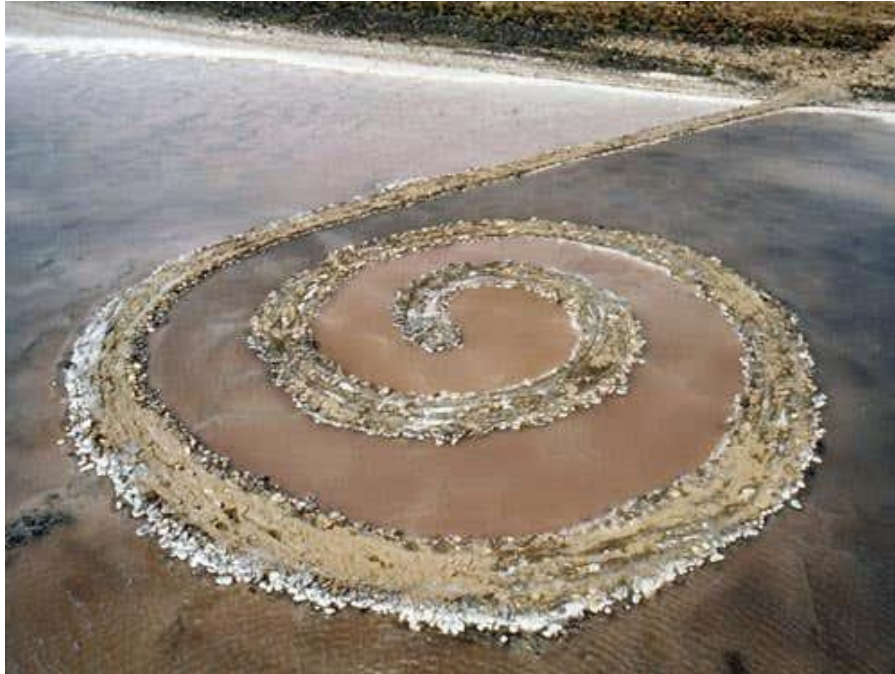
Medidas: Entre 470 y 480 metros de extensión.