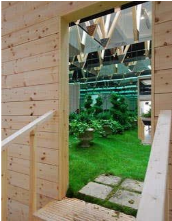
Green Room, A12, 2009. Instalación.