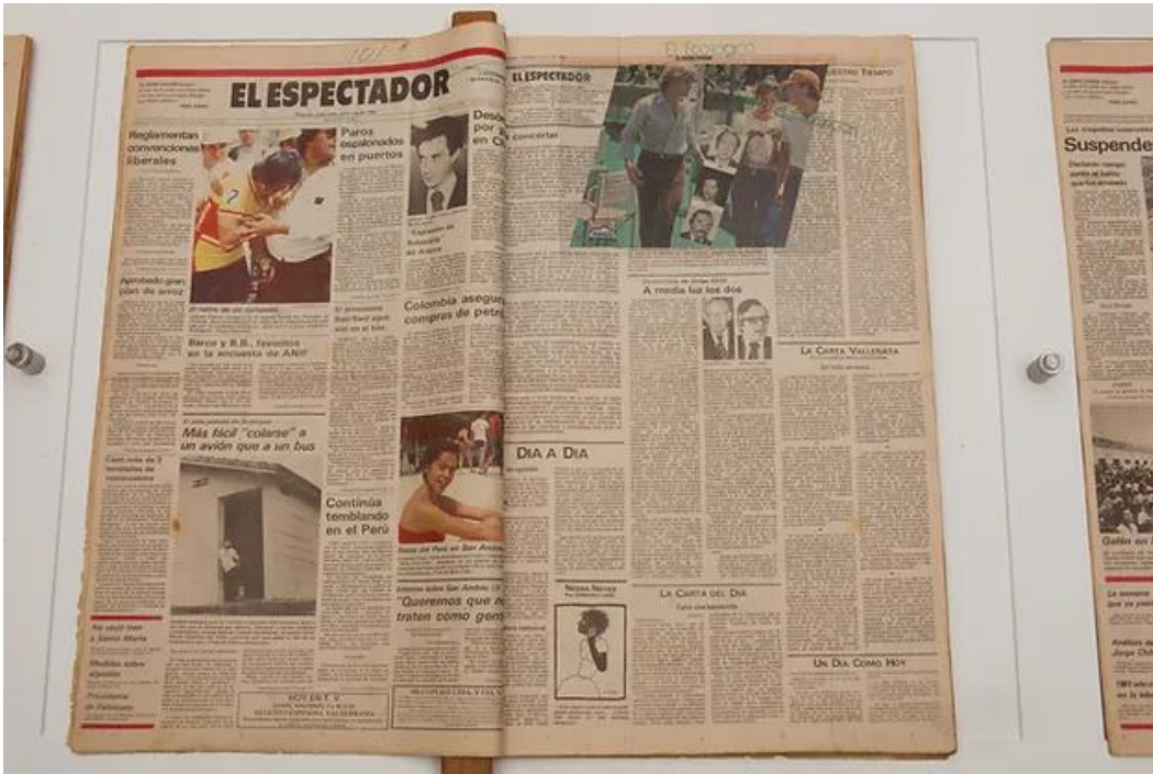
Título de la obra: El ecológico Técnica: Arte conceptual. Dimensiones: 2x39x62cm Año de realización: 1981-82.