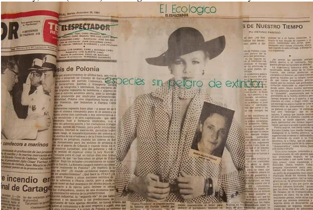
Título de la obra: El ecológico Técnica: Arte conceptual. Dimensiones: 2x39x62cm Año de realización: 1981-82.