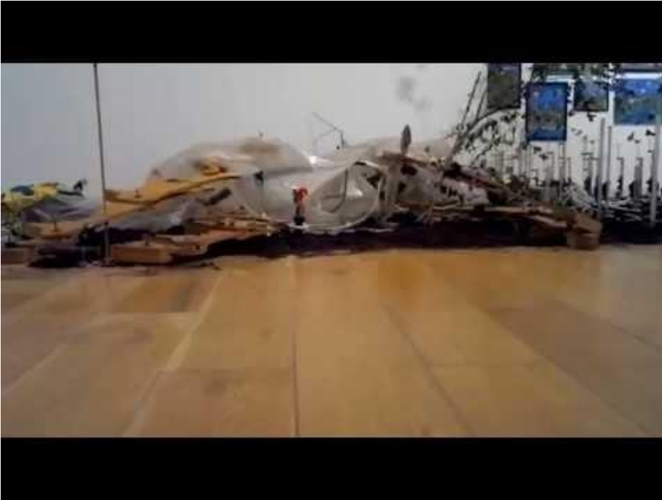
Jimmie Durham Cortez Nottingham Contemporary January 2015 YouTube, 28 ene 2015 https://www.youtube.com/watch?v=UiRUloZFFX8