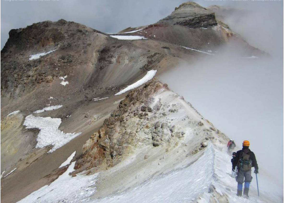
Montañismo en PN Itzacchuatl-Popocatepetl, EDOMEX